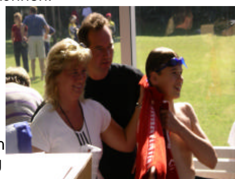
glückliche Eltern nach den Sieg